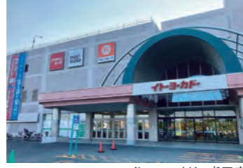
イトーヨーカドー屯田店