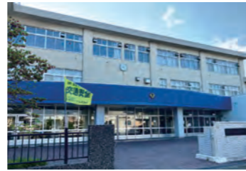
札幌市立篠路西中学校