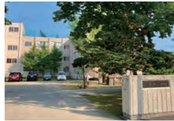
札幌市立茨戸小学校