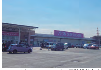
イオンスーパーセンター石狩緑苑台店