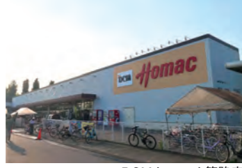
DCMホームマック篠路店